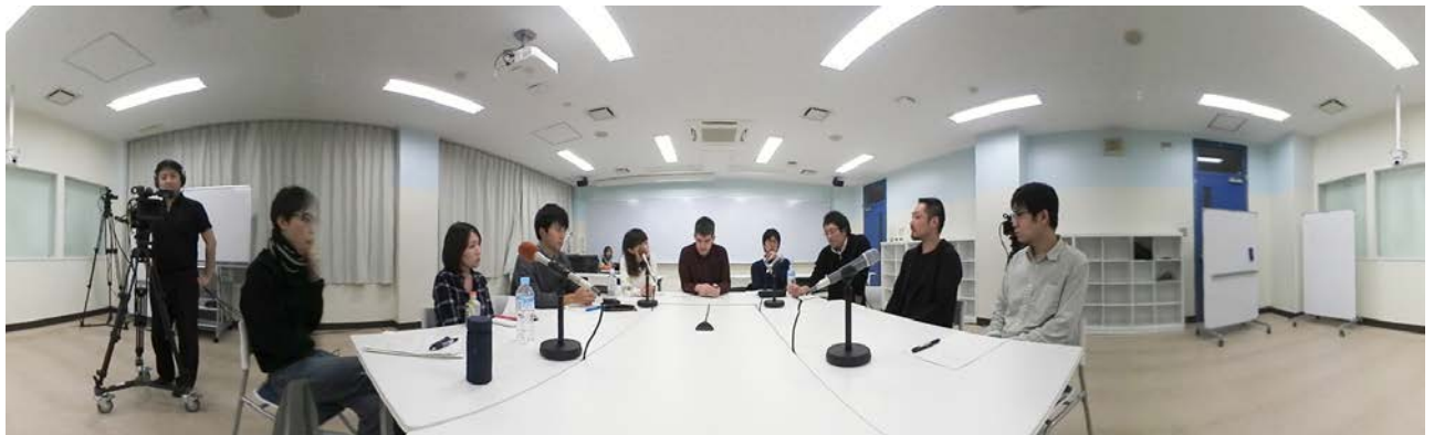
本講座で提供予定のVR動画